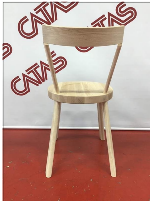
Vista da dietro