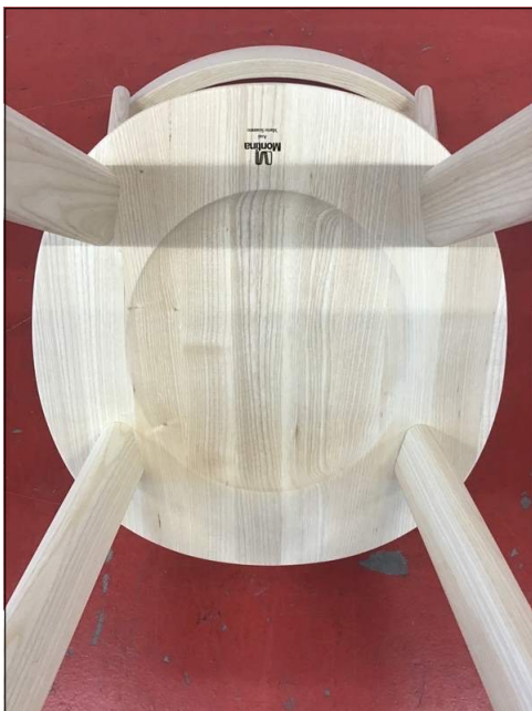
Vista da sotto

La denominazione e l'eventuale descrizione del campione sono dichiarate dal cliente; il CATAS non s'impegna a verificarne la veridicità. I risultati riportati sul rapporto di prova si riferiscono solo al campione provato. Aggiunte, cancellazioni o alterazioni non sono ammesse. Il rapporto di prova non può essere riprodotto parzialmente. Se non diversamente previsto da norme, specifiche tecniche o accordi con il cliente le eventuali dichiarazioni di conformità formulate dal CATAS si basano sul confronto tra i risultati ed i valori di riferimento senza considerare l'intervallo di confidenza della misura. Salvo diversa indicazione, il campionamento è stato effettuato dal cliente: in tal caso i risultati ottenuti si considerano riferiti al campione così ricevuto.